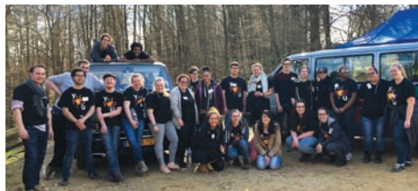
Une vingtaine de jeunes bénévoles ont encadré près de 400 enfants lors de l'événement « Konscht am Bësch ».

Voici quelques-uns des événements qui ont marqué l'année 2018 côté bénévoles.