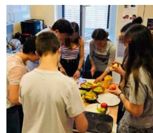
Tous les mois, de jeunes bénévoles préparent un brunch pour les patients de la Clinique d'Eich.