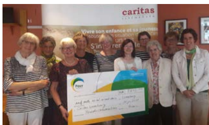
Le stand de Caritas Luxembourg à l'Octavemäertchen est organisé et animé par de nombreux bénévoles.