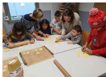
Ateliers de pâtisserie organisé par des bénévoles pour les enfants des foyers pour réfugiés