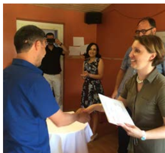
Des bénévoles donnant des cours de langues remettent les certificats de participation aux réfugiés.