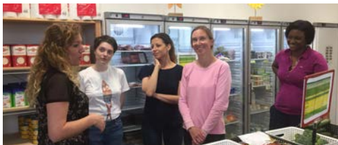
Des collaborateurs d'Amazon s'engagent au « Caritas Buttek » de Luxembourg-Ville pendant leur pause de midi.