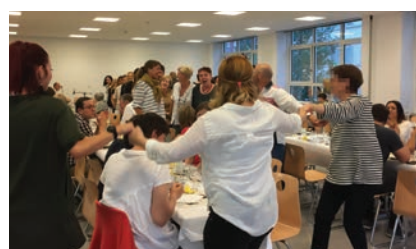
Ambiance chaleureuse lors de la fête en l'honneur des bénévoles.