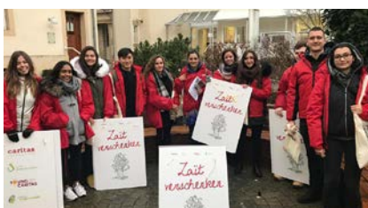
De jeunes bénévoles participent à l'action « Zait verschenken » pendant la période de Noël.