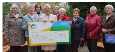
Comme tous les ans, Caritas Luxembourg peut compter en mai pour sa collecte porte-à-porte sur l'engagement de nombreux quêteurs et quêteuses.